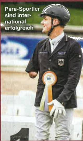
Para-Sportler sind international erfolgreich

Therapeutisches Reiten ist eine pferdegestützte Therapie für Menschen mit Einschränkungen