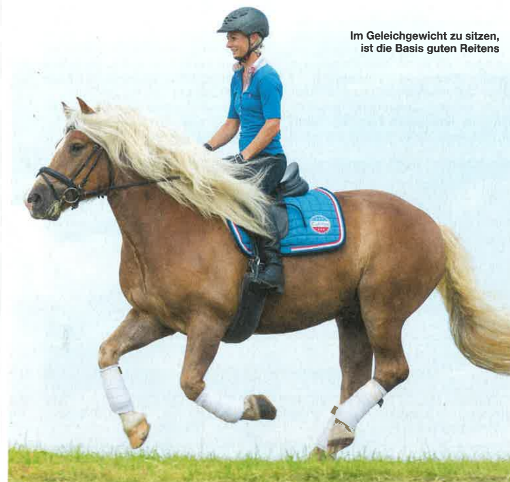
Im Gleichgewicht zu sitzen, ist die Basis guten Reitens

Sie meint, dass eingeschränkte Reiter viel mehr Gefühl zu ihrem Körper zulassen müssen als gesunde. „Wir können nicht so reiten wie andere und müssen deshalb schauen, wo Ressourcen sind, die wir nutzen können. Ich glaube, dass sich jeder Reiter – unabhängig, ob er eingeschränkt ist oder nicht – fragen sollte, wie gut bin ich mit meinem Körper und meiner Muskulatur aufgestellt, um eine normale Hilfengebung ausführen zu „