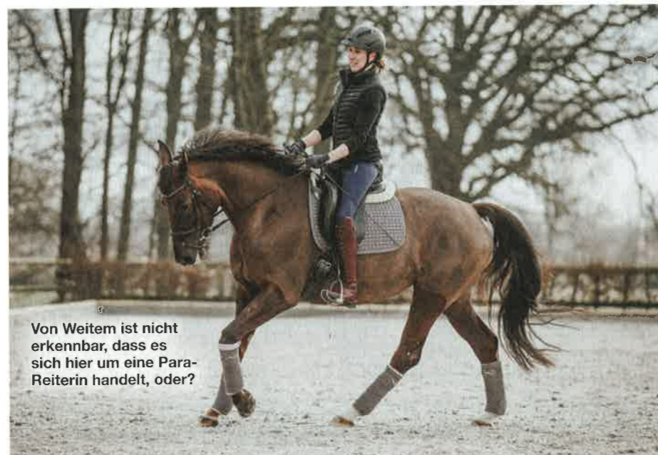
Von Weitem ist nicht erkennbar, dass es sich hier um eine Para-Reiterin handelt, oder?

Die Reiterin verkrampfte sich im Moment des Antrabens und gab so ein falsches Signal. Die Ursache lag tief in ihrem Körper verborgen: „Vor Jahren hatte ich mal einen schweren Reitunfall mit Einblutungen in die Lunge. Dadurch entstand eine Art Klebschicht zwischen Lunge und Zwerchfell. Durch das verkrampfte Zwerchfell bekam ein Hüftbeuger mehr Zug und ich schob