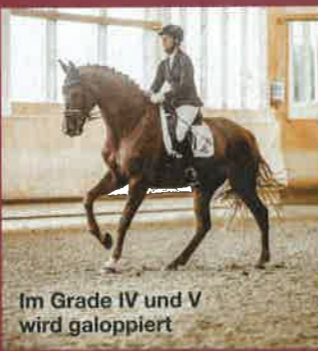
Im Grade IV und V wird galoppiert