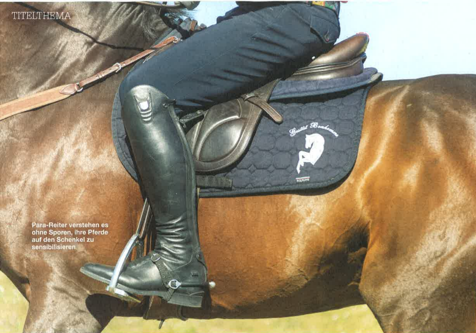
Para-Reiter verstehen es ohne Sporen, ihre Pferde auf den Schenkel zu sensibilisieren